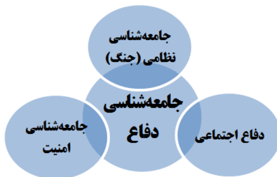
شکل شماره (۱): نسبت جامعه‌شناسی امنیت، نظامی (جنگ) و دفاع اجتماعی با جامعه‌شناسی دفاع

جامعه‌شناسی جنگ یا جامعه‌شناسی نظامی، تمامی ابعاد و زوایای مباحث مرتبط با امر دفاعی را در برنمی‌گیرد؛ به عبارت دیگر، هر کدام بخشی از واقعیت‌ها را بیان نموده و بخشی دیگر از مسائل را مورد توجه قرار نمی‌دهند. جامعه‌شناسی دفاع با دفاع اجتماعی نیز تفاوت دارد. دفاع اجتماعی به معنای مقاومت غیرخشونت‌آمیز جامعه در برابر تجاوز و تهاجم است که جایگزینی برای دفاع نظامی به‌شمار می‌آید. (Martin, 1993) این تعریف به‌خوبی بیانگر تمایزهای این دو گرایش می‌باشد. گفتنی است باوجود این اختلاف‌ها، برخی جنبه‌های تشابه نیز بین این گرایش‌ها وجود دارد؛ از جمله این تشابه‌ها می‌توان به نقش‌آفرینی عامل سرمایه اجتماعی در جامعه‌شناسی امنیت و جامعه‌شناسی دفاع، روابط غیرنظامیان و نظامیان بین جامعه‌شناسی نظامی و جامعه‌شناسی دفاع و وجود ویژگی‌هایی همچون اراده و روحیه در دفاع اجتماعی و جامعه‌شناسی دفاع اشاره کرد.