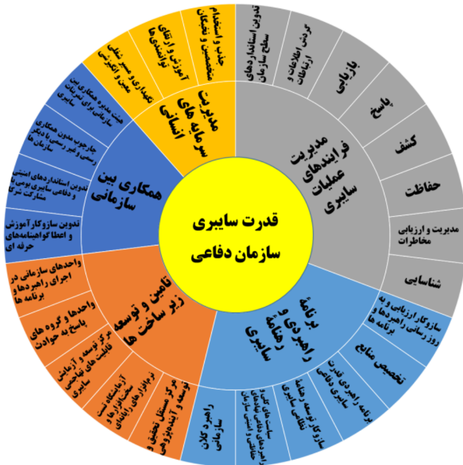
شکل شماره (۲): نمودار مفهومی الگوی قدرت سایبری