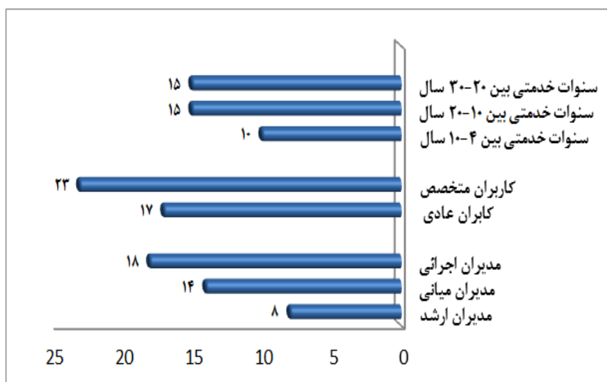
شکل شماره (۲) ترکیب نمونه آماری

جامعه آماری پژوهش شامل دو گروه از سازمان مورد مطالعه (که یکی از سازمان-های نیروهای مسلح است) می شود؛ گروه اول شامل استادان، خبرگان، دانشجویان و پژوهشگران حوزه اطلاعات مکانی و گروه دوم شامل مدیران، تصمیم گیرندگان، مسئولان و کاربران سطوح مختلف اجرایی حوزه اطلاعات مکانی با سنوات خدمتی، سطوح مدیریت و سطح تخصصی متفاوت می باشند که با توجه به حساسیت و خاص بودن موضوع پژوهش، نمونه گیری به روش سهمیه ای و به شکل نسبی و بر اساس فرمول کوکران تعداد ۴۰ نفر (از هر گروه ۲۰ نفر) محاسبه شده و با توجه به اهداف تحقیق به شکل هدفمند تلاش گردیده تا از هر زیرگروه تعداد مشخصی در نمونه باشد. شکل شماره (۲) ترکیب جامعه نمونه با توجه به عوامل سنوات خدمتی، نوع کاربر و سطح مدیریت را نشان می دهد.