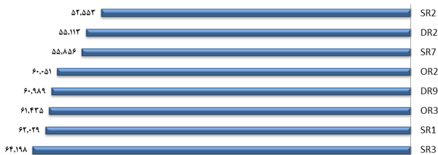
شکل شماره (۶) هشت خطرپذیری دارای اولویت بر اساس عدد شاخص اولویت خطرپذیری