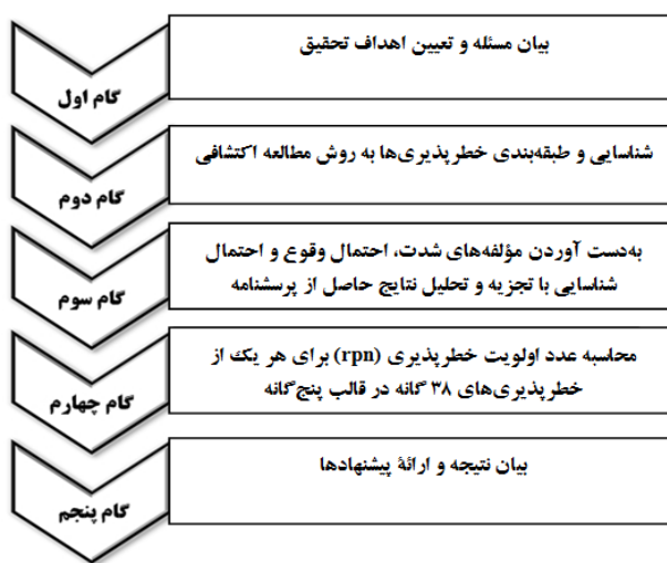
شکل شماره (۱) مراحل انجام تحقیق

شناسایی نیز عدد ۵ نمایانگر خطرپذیری‌هایی است که احتمال شناسایی آنها تا زمان وقوع بسیار کم است و عدد ۱ نیز نشانگر خطرپذیری‌هایی است که می‌توان با دستورکار یا آیین نامه مشخص، آن‌را شناسایی و از وقوع آن جلوگیری کرد. در مرحله بعد شاخص اولویت خطرپذیری ۱ که حاصل ضرب سه شاخص شدت خطرپذیری، احتمال وقوع و احتمال شناسایی است، برای هر یک از خطرپذیری‌ها تعیین گردید. سپس خطرپذیری‌ها در هر یک از ابعاد از نظر شاخص اولویت خطرپذیری، اولویت-بندی شدند. در روش عوامل شکست و آثار آن، با استفاده از امتیازدهی شاخص اولویت خطرپذیری، می‌توان نمره اولویت خطرپذیری را تعیین نمود. این رهنمود بیانگر این است که اعداد با اولویت بالا خطرپذیری بالاتر، جهت تجزیه و تحلیل و تخصیص منابع (اهداف بهبود) مقدم می‌باشند و گروه پروژه بایستی روی خطرپذیری‌هایی کار کند که شاخص اولویت خطرپذیری بالاتری دارند.