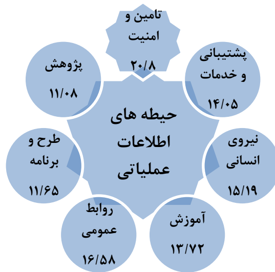
نمودار شماره (۴): حیطه های اطلاعات عملیاتی

نمودار شماره (۵) شاخص ها و حیطه های فضای اطلاعات مهندسی را نمایش می دهد که در آن مهم ترین حیطه مشخص گردیده است. نمودار مزبور بیان می دارد که در فضای اطلاعات مهندسی، حوزه روابط عمومی دارای بیشترین تأثیر است و این مهم بیانگر این مطلب است که در سازمان های گردآوری اطلاعات مهندسی بایستی از روابط عمومی قوی برخوردار بود. در صورتی که تأیید حیطه آموزشی در فضای اطلاعات مهندسی منطقی تر به نظر می رسد. برابر نتایج به دست آمده از پرسشنامه تحقیق بیانگر این مطلب است که به علت ضعف روابط عمومی و تعامل ضعیف با سازمان ها و سیستم های خارج از سازمان در سطح نیروهای مسلح به ویژه ارتش جمهوری اسلامی ایران، حیطه روابط عمومی دارای بیشترین ارزش و تأثیر گردید.