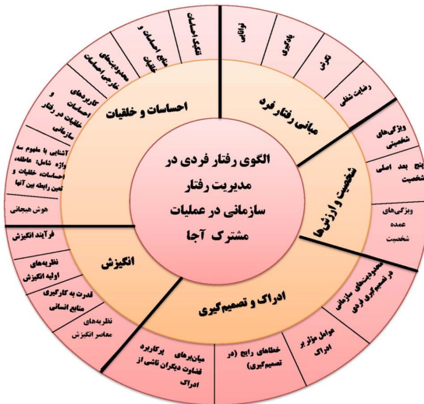
شکل ۴-۱ الگوی رفتار فردی مدیریت رفتار سازمانی در عملیات مشترک آجا

با عنایت به موارد مطروحه فوق و نتایج حاصله از این پژوهش به نظر می‌رسد «توجه به بعد رفتار فردی در همه سازمان‌ها و از جمله ارتش ج.ا.ایم است غیرقابل انکار و فرماندهان، رؤسا و مدیران در کلیه سطوح فرماندهی و مدیریتی خود و به‌طور خاص در عملیات مشترک می‌بایستی توجه ویژه‌ای نمایند».