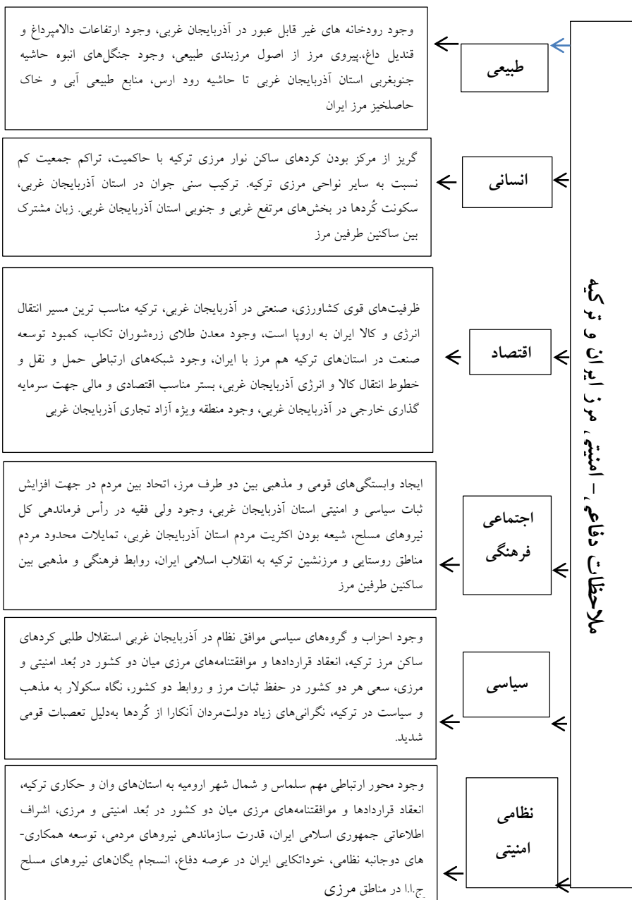
شکل شماره ۲ چارچوب تحلیلی تحقیق