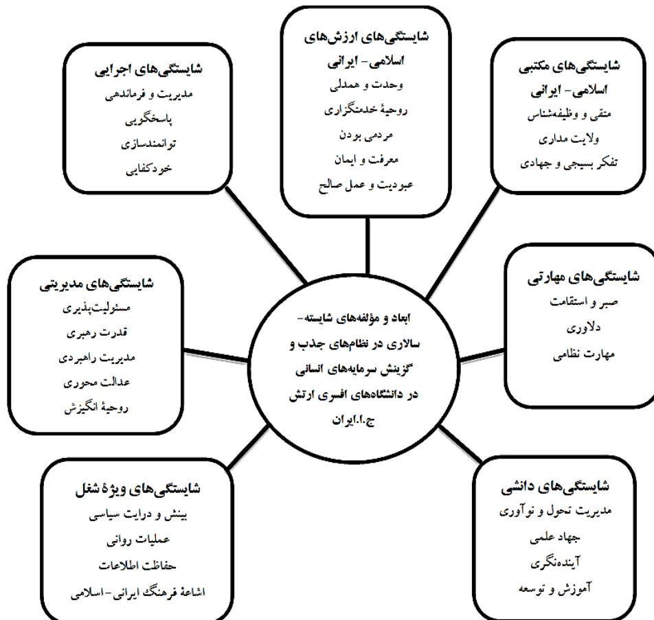
شکل شماره (۱): الگوی مفهومی شایسته‌سالاری در نظام‌های جذب و گزینش سرمایه‌های انسانی در دانشگاه‌های افسری ارتش ج.ا.ایران